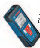
レーザー 距離計測器